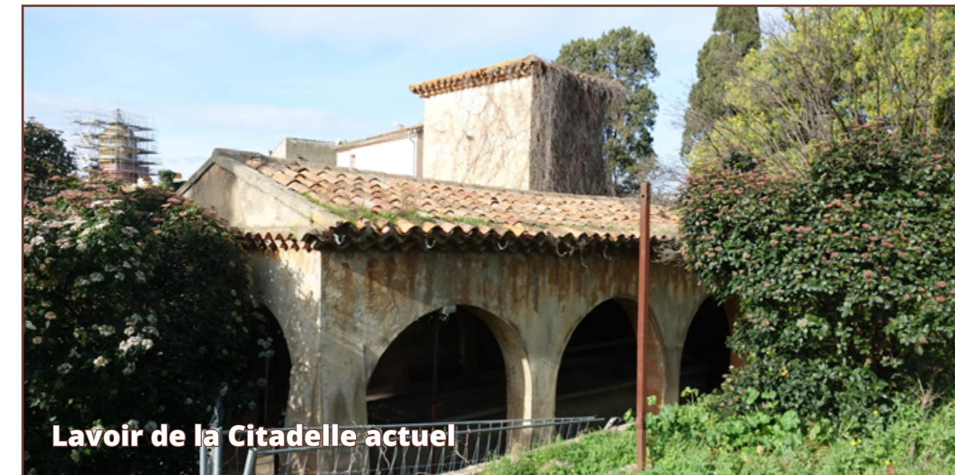
Lavoir de la Citadelle actuel