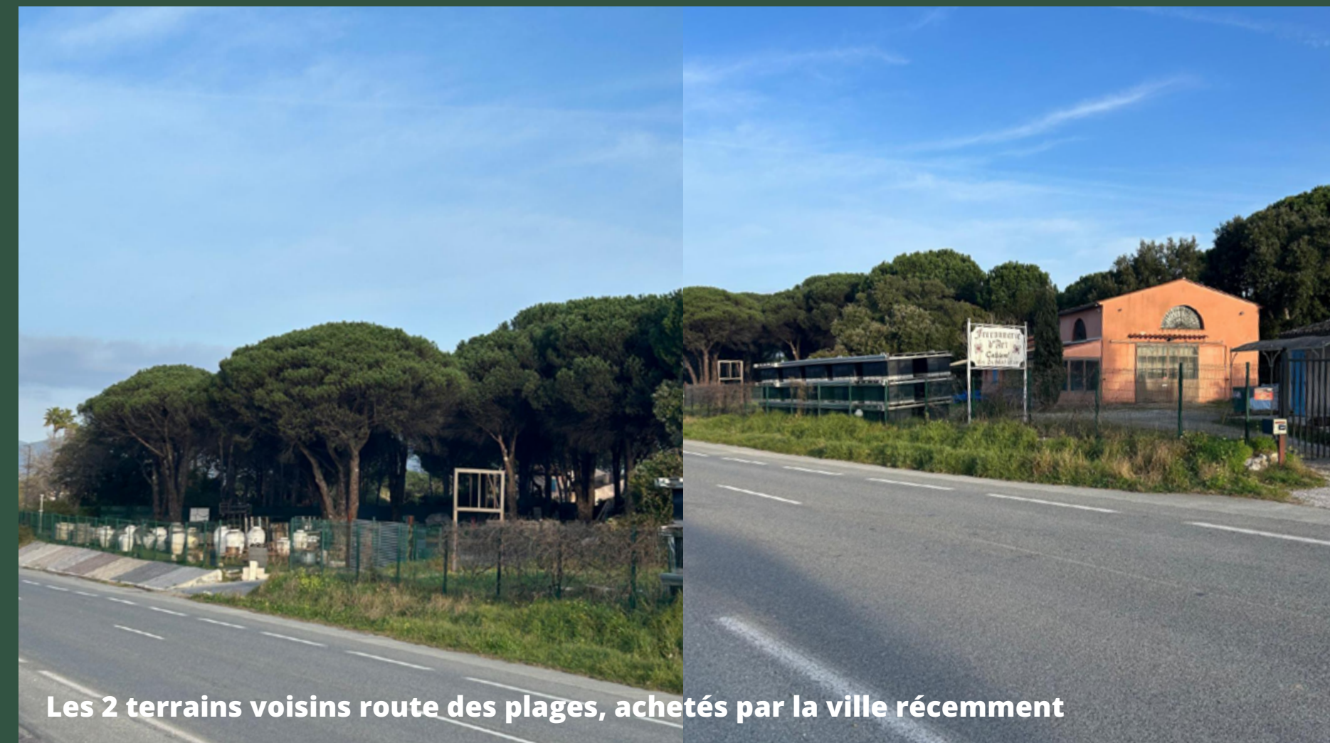
Les 2 terrains voisins route des plages, achetés par la ville récemment