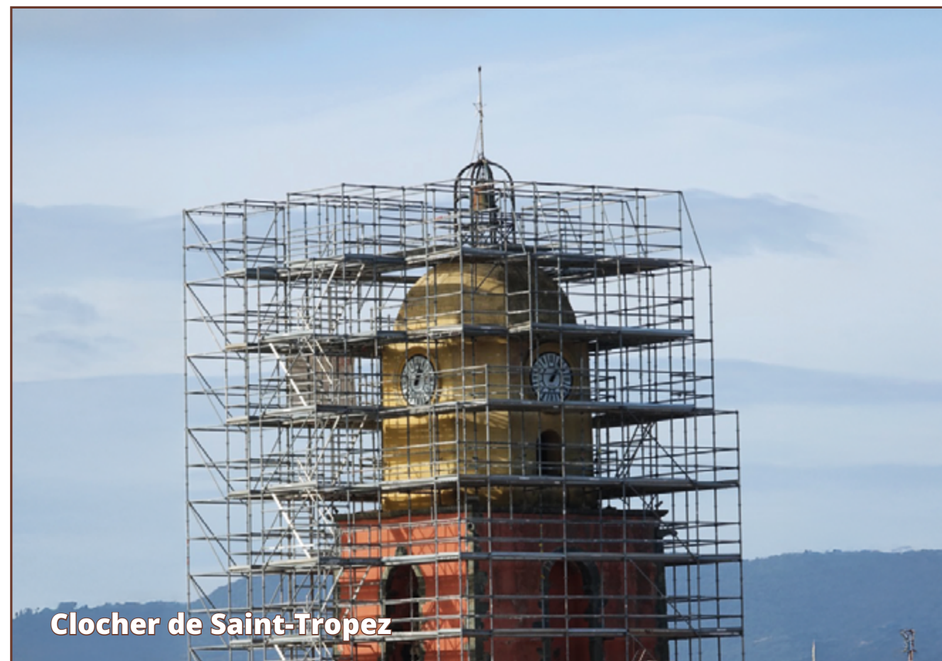
Clocher de Saint-Tropez