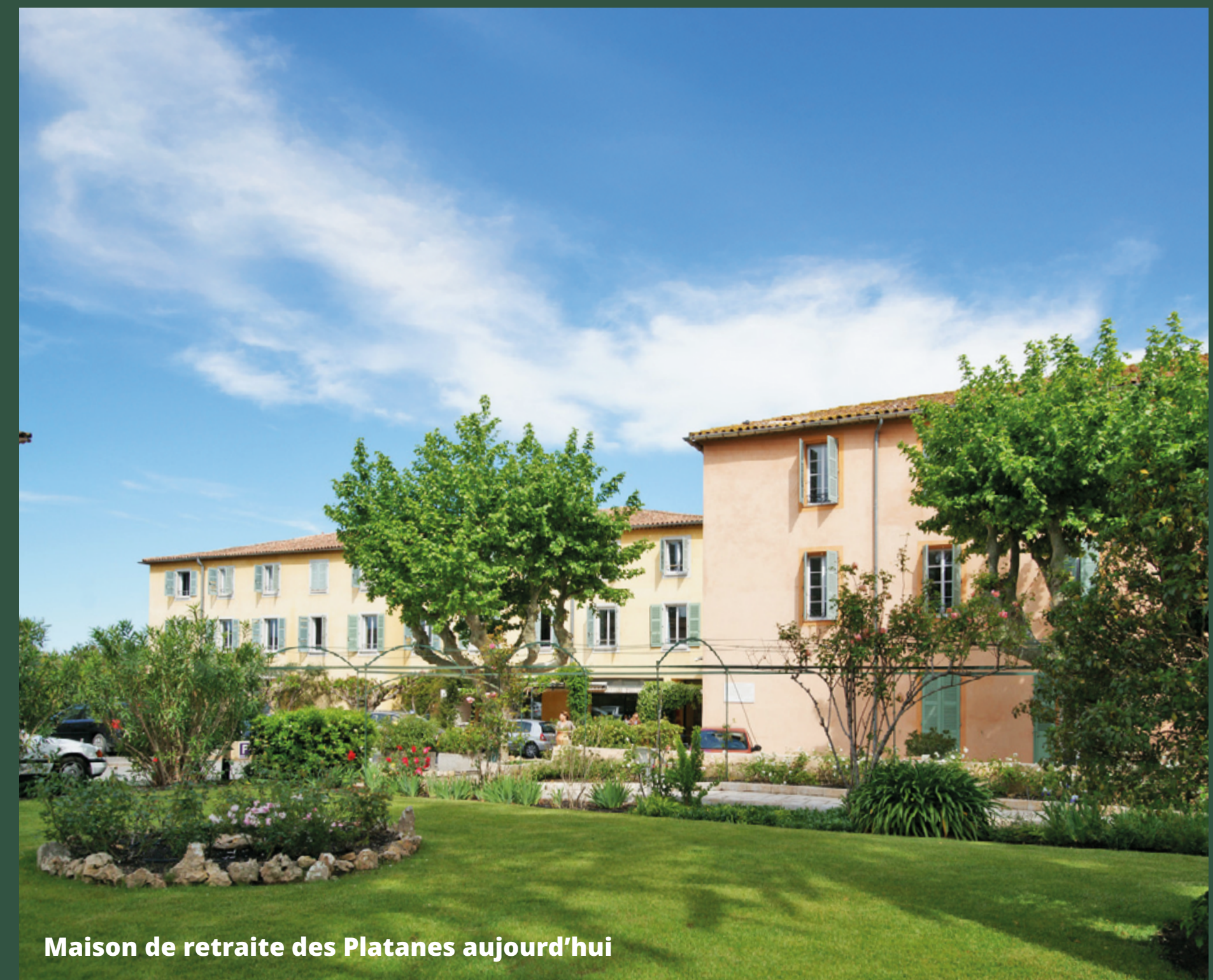
Maison de retraite des Platanes aujourd'hui