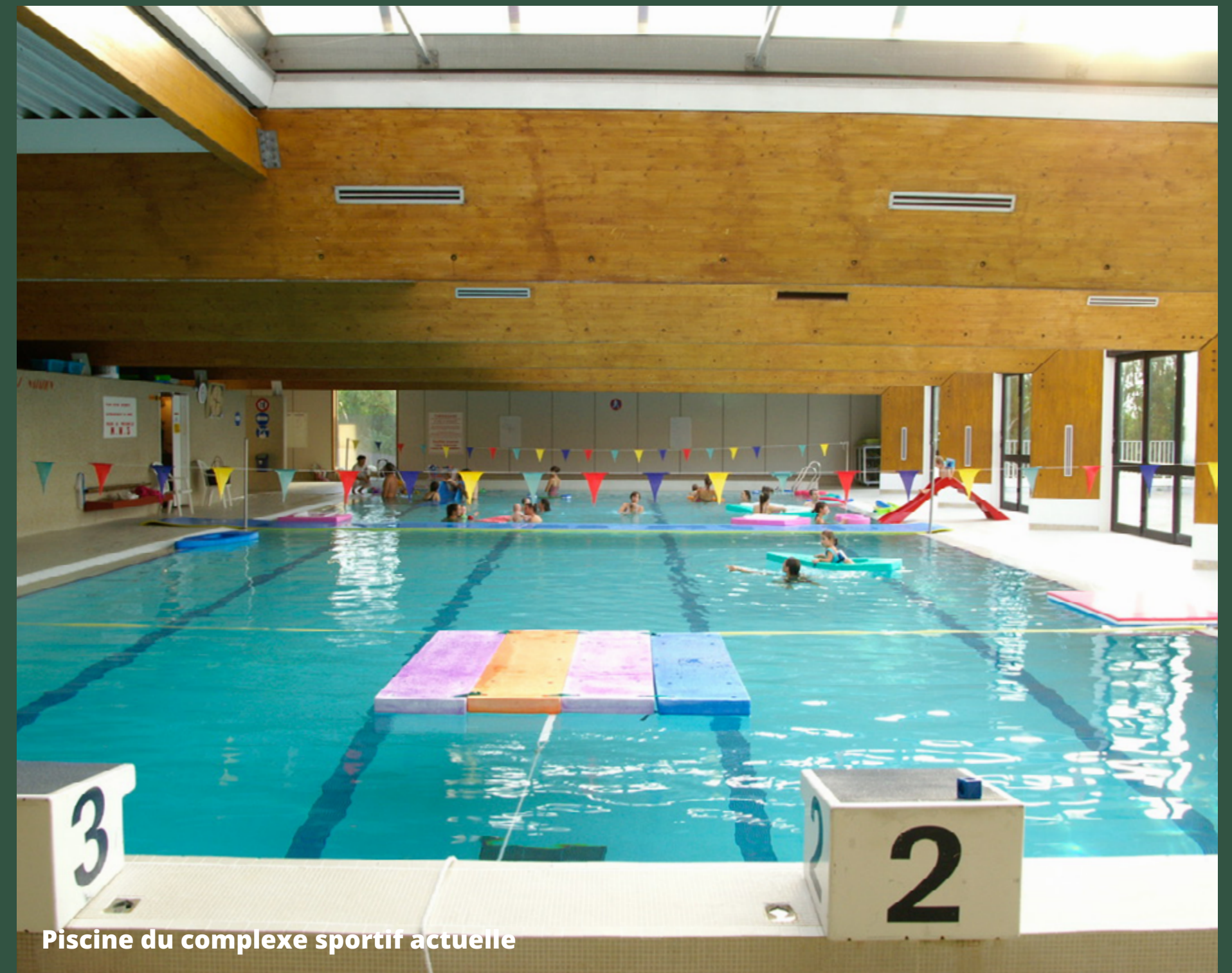
Piscine du complexe sportif actuelle