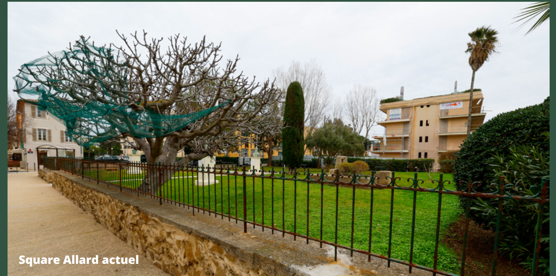
Square Allard actuel

UN PARKING STRUCTURANT DE 570 PLACES, À L'ENTRÉE DE VILLE, FINANCÉ SANS PESER SUR LA COMMUNE, POUR RÉPONDRE DURABLEMENT AU DÉFI DU STATIONNEMENT