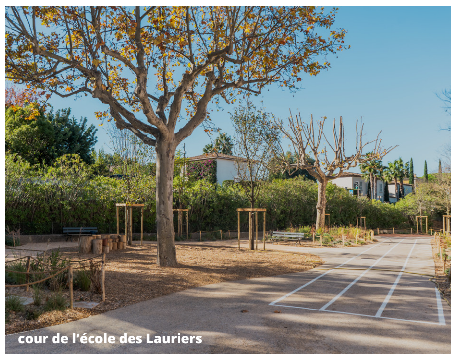
cour de l'école des Lauriers