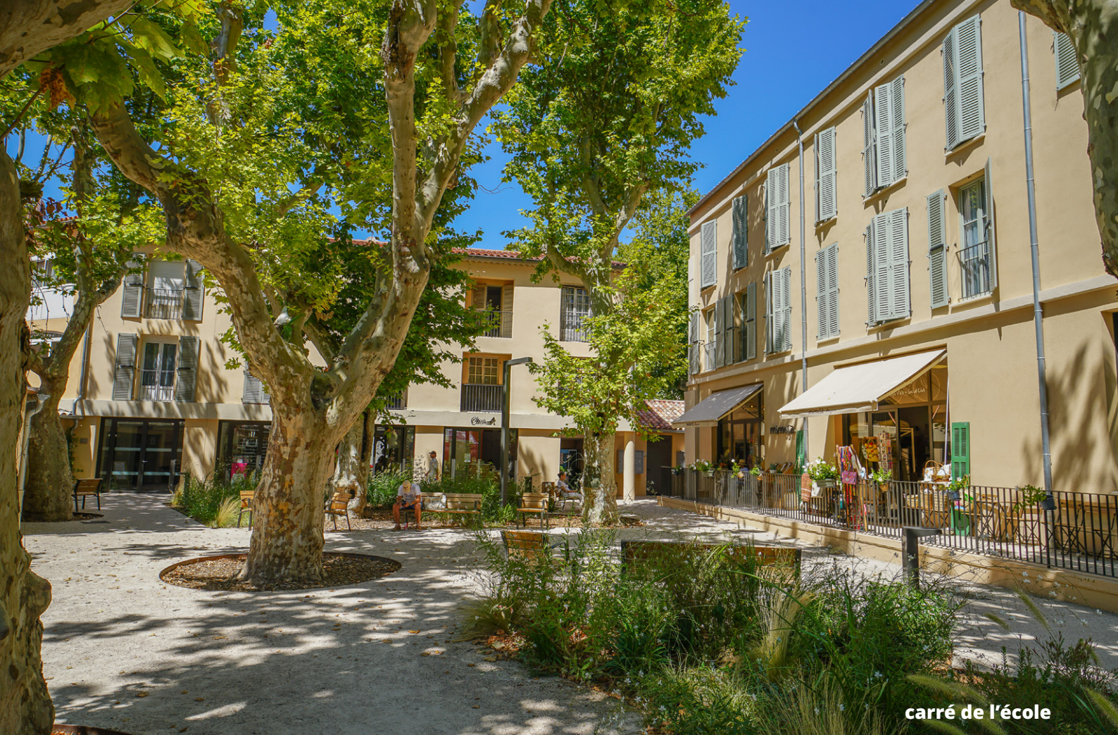
carré de l'école