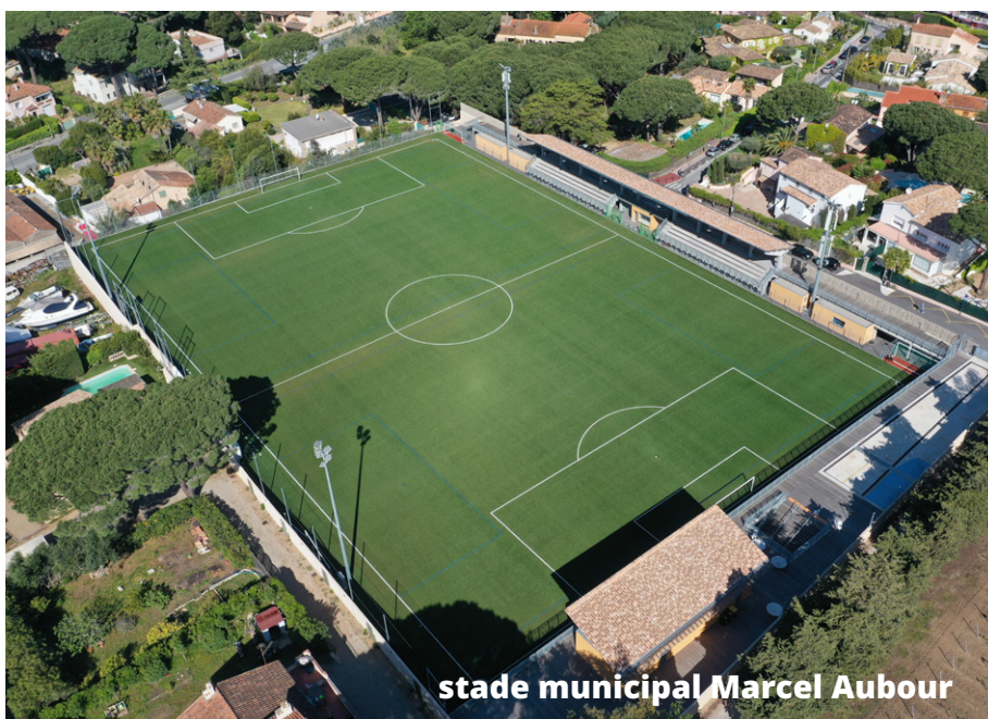
stade municipal Marcel Aubour