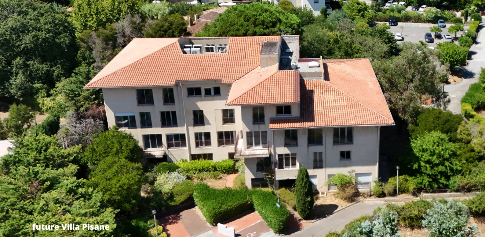
future Villa Pisane