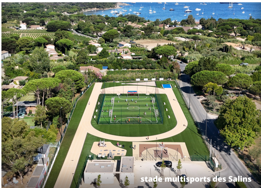
stade multisports des Salins