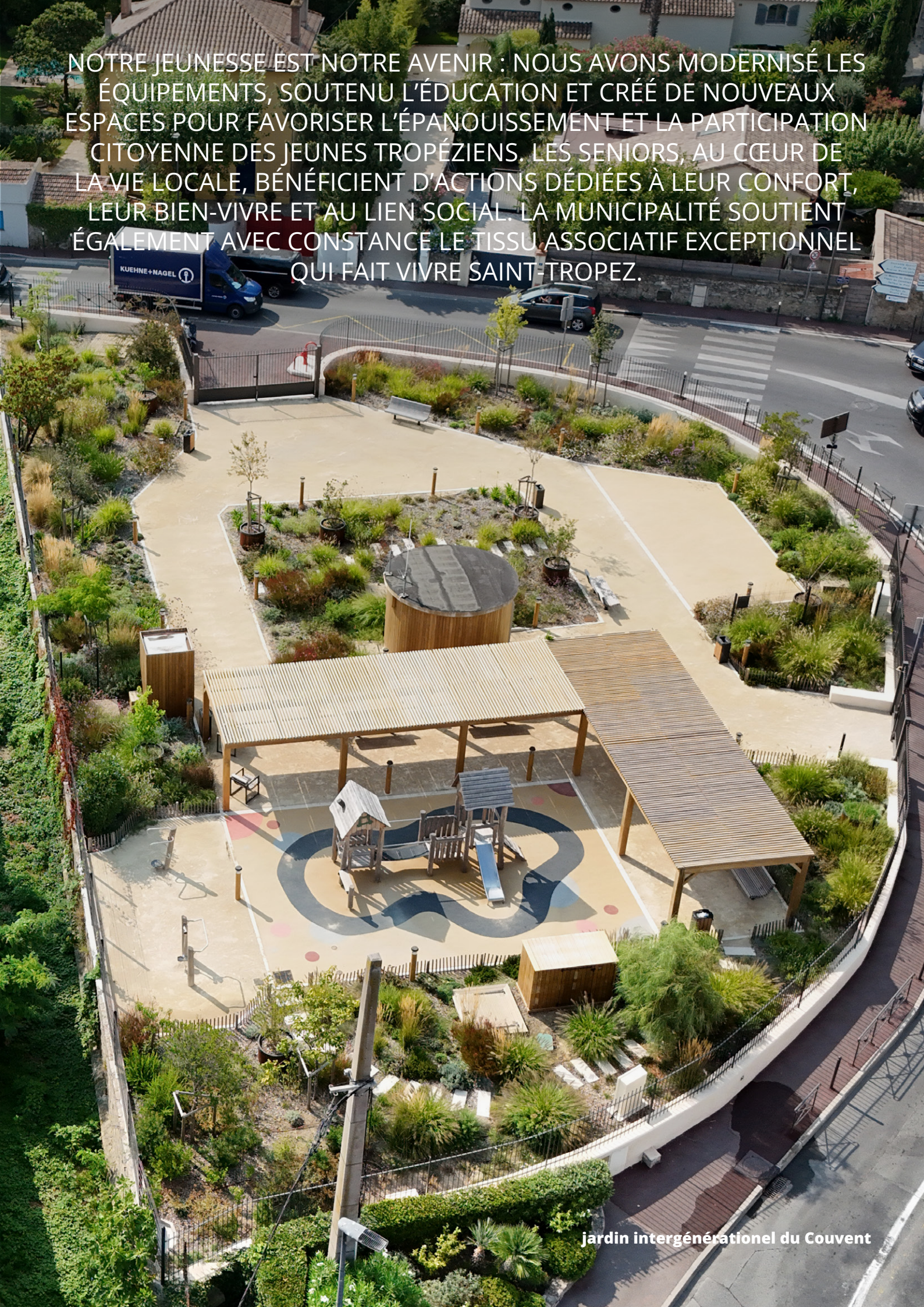
jardin intergénérationnel du Couvent

NOTRE JEUNESSE EST NOTRE AVENIR : NOUS AVONS MODERNISÉ LES ÉQUIPEMENTS, SOUTENU L'ÉDUCATION ET CRÉÉ DE NOUVEAUX ESPACES POUR FAVORISER L'ÉPANOUISSEMENT ET LA PARTICIPATION CITOYENNE DES JEUNES TROPÉZIENS. LES SENIORS, AU CŒUR DE LA VIE LOCALE, BÉNÉFICIENT D'ACTIONS DÉDIÉES À LEUR CONFORT, LEUR BIEN-VIVRE ET AU LIEN SOCIAL. LA MUNICIPALITÉ SOUTIENT ÉGALEMENT AVEC CONSTANCE LE TISSU ASSOCIATIF EXCEPTIONNEL QUI FAIT VIVRE SAINT-TROPEZ.