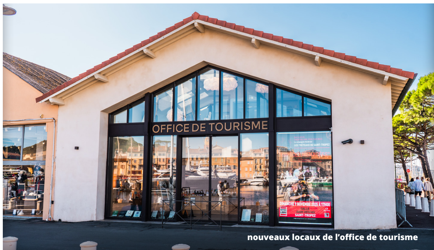
nouveaux locaux de l'office de tourisme