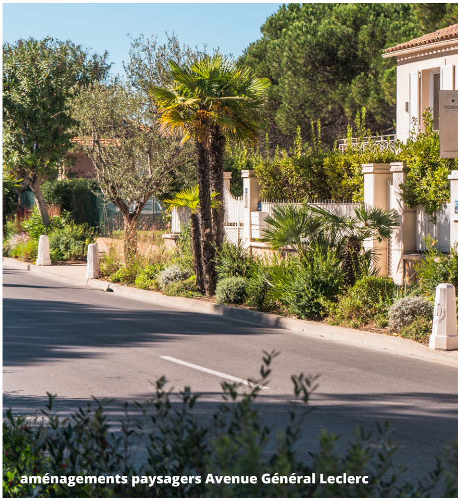
aménagements paysagers Avenue Général Leclerc