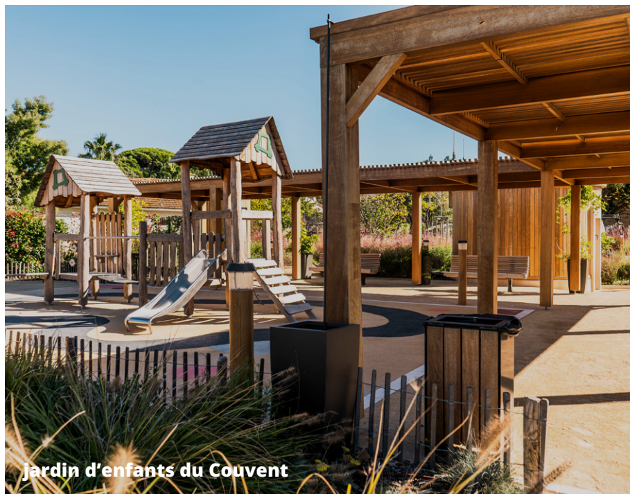
Jardin d'enfants du Couvent