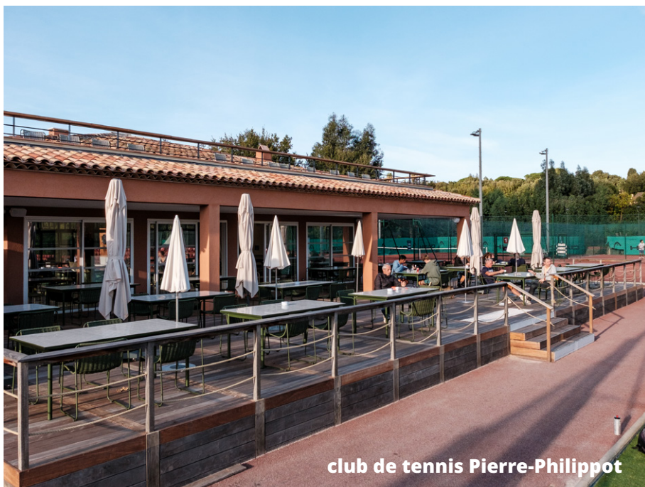
club de tennis Pierre-Philippot