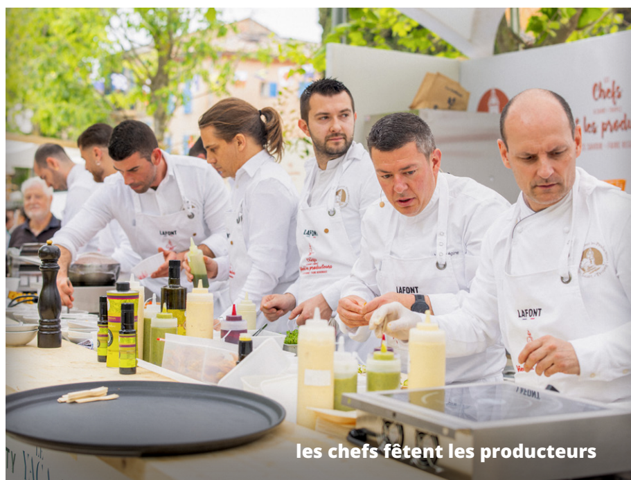
les chefs fêtent les producteurs